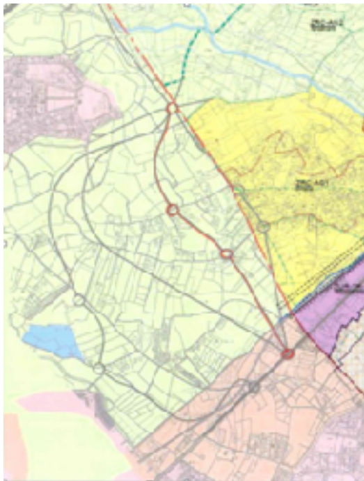
Vial elegido por el Equipo de Gobierno en su declaración del 8 de agosto.

“Además, el Equipo de Gobierno , en su declaración del 8 de agosto apuesta por uno de los 4 viales por ser el que da una mejor solución a las necesidades de conexión no sólo de nuestro municipio si no también de los pueblos limítrofes , no obstante, en el Plan General publicado se elige otro diferente al de la declaración. ¿Alguien lo entiende?”