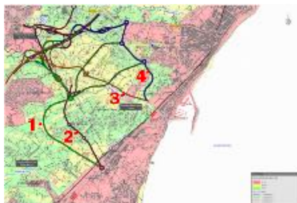
4 viales propuestos por Conselleria

“El despropósito con las alternativas de viales entre Alfaz del Pi y Altea sigue aumentando. No sólo se han proyectado dichos viales sin el consentimiento de Alfaz del Pi , si no que