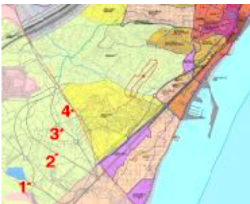
4 viales propuestos por el Ayuntamiento de Altea